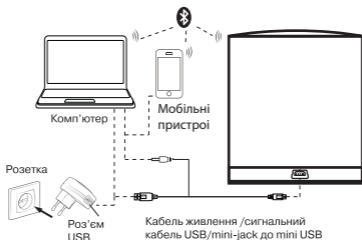
Мал. 2. Схема підключення