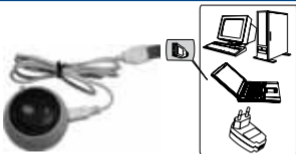
3-сурет. Аккумулятордың зарядкалауы