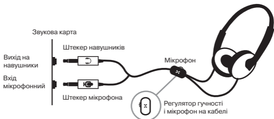
Мал. 1. Схема підключення