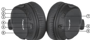
Imag. 1. Construcția căștilor

⑨ Indicator LED sistem activ de anulare a zgomotului (ANC)