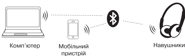
Мал. 2. Схема підключення