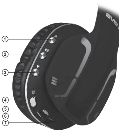
Fig. 1. Headphones design