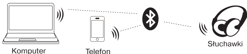
Rys. 2. Schemat połączenia