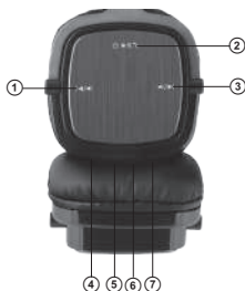
Рис. 1. Устройство наушников