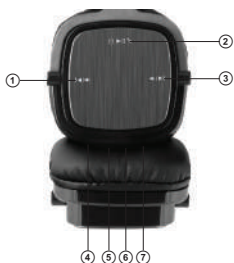
Fig. 1. Headphones design