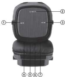
Мал. 1. Конструкція навушників