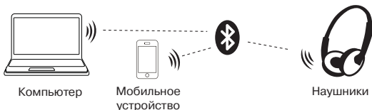
Рис. 2. Схема подключения