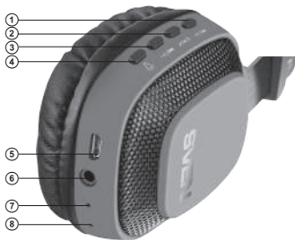
Fig. 1. Headphones design