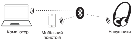
Мал. 2. Схема підключення