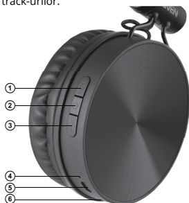
Fig. 1. Construcția căștilor