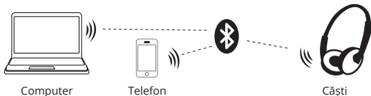
Fig. 2. Schema de conexiune