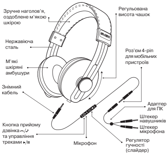
Мал. 1. Схема підключення