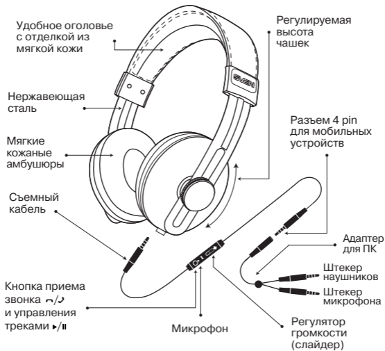
Рис. 1. Схема подключения