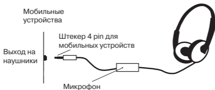
Рис. 1. Схема подключения