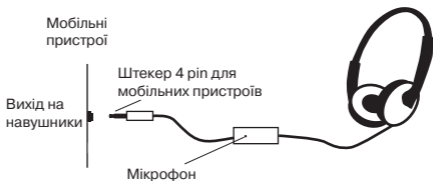
Мал. 1. Схема підключення